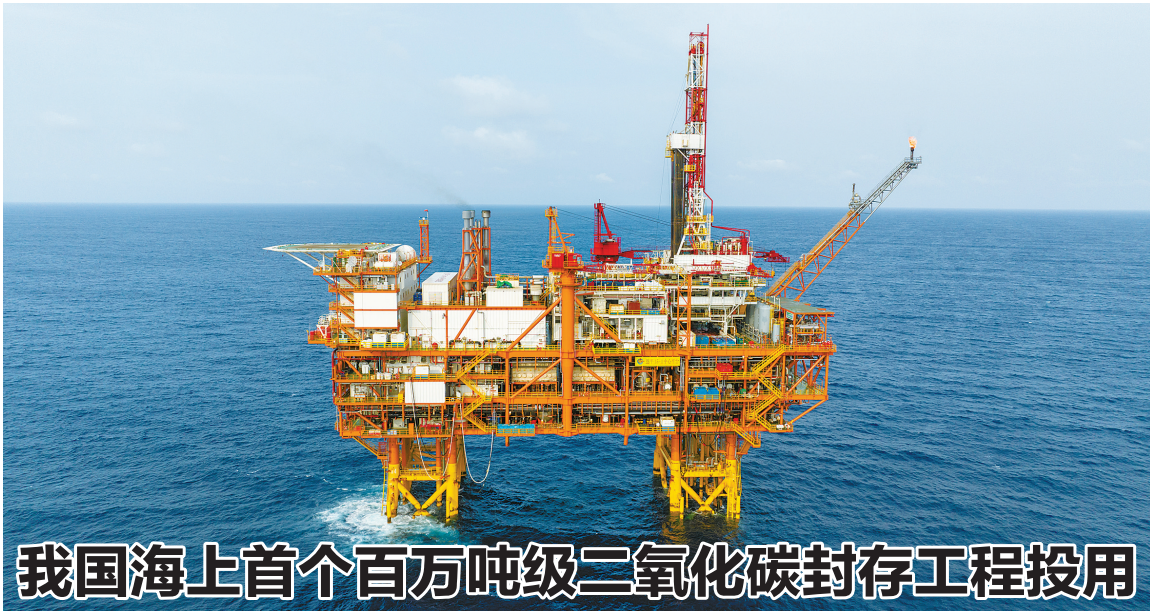
我国海上首个百万吨级二氧化碳封存工程投用

2025年年初,并对2024财年和2025财年的开支进行限制。按照立法程序,该法案还需在参议院获得通过,再递交总统拜登签字后方能生效。