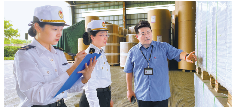
宁波海关关员入企调研为企业出口菲律宾货物提供RCEP原产地政策指导。

据统计，自2022年1月RCEP正式生效到今年5月底，宁波海关共为辖区企业签发RCEP原产地证书36164份，企业自主开具RCEP原产地声明2287份，享惠货值突破15亿美元，主要签证产品有塑料制品、纺织服装、水产品等。