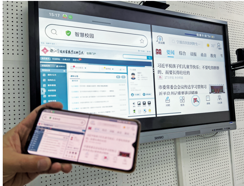
不管是校内还是校外,手机都可以实现内外网无缝切换。

建设拉开了新的序幕。按照计划,下一步,浙江纺织服装职业技术学院将与宁波移动加快推进5G与科研教学的深度融合,打造一系列“5G+智慧校园”标杆示范项目。与此同时,推动5G与时