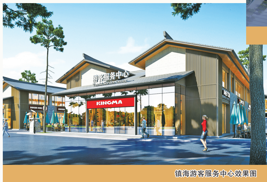
镇海游客服务中心效果图

扩大新基建，推动活力城区建设。加快数字化。让5G、物联网等现代信息技术进家庭、进楼宇、进社区，联动推进地下管网等各类“老基建”智能化改造，提升城市运行智能化水平。提高新能源化。加大既有建筑节能改造，探索推进分布式可再生能源利用，扩大充电桩、换电站、加氢站建设布局，推进城市新能源化发展。