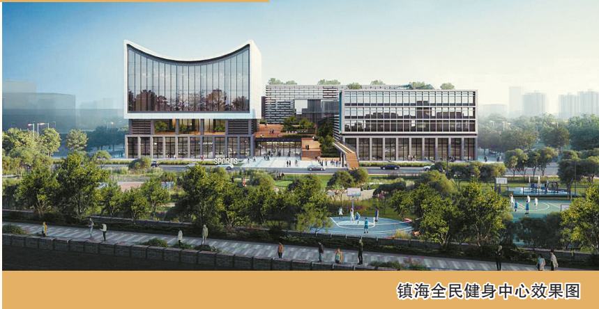
镇海全民健身中心效果图