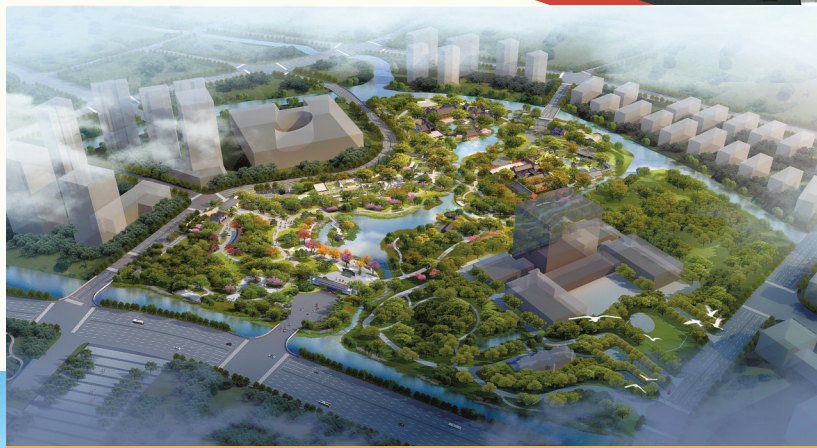
海曙翠柏里效果图