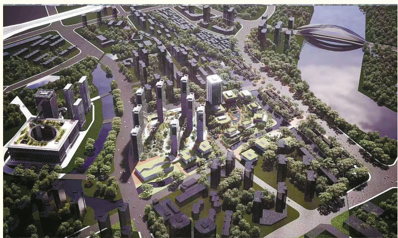
海曙京东方创新中心

持续打造均衡优质的美丽城镇生活圈，联城带村，构建优质均衡的城乡公共服务体系，统筹推进高品质城镇生活圈建设。多类型联动推进美丽城镇集群行动，强化设计引领，片区化实施老旧城镇改造与产业空间再造，每年推出一批更新成效显著的特色镇城，推动高质量发展建设共同富裕示范市。