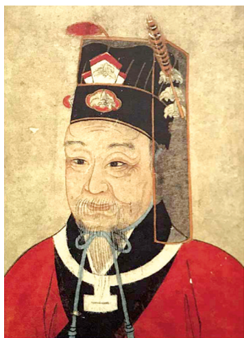
史弥坚像（资料照片）

史弥坚了解到起义队伍中的多数人是为饥寒所迫，便决定对义军进行招抚。他派人给黑风峒送去一批粮食和食盐，并上奏朝廷，要授予罗孟传官职。罗孟传闻讯后愉快地接受了招安。就这样，史弥坚成功平息罗孟传之乱。罗孟传后来再度作乱，于嘉定四年（1211年）九