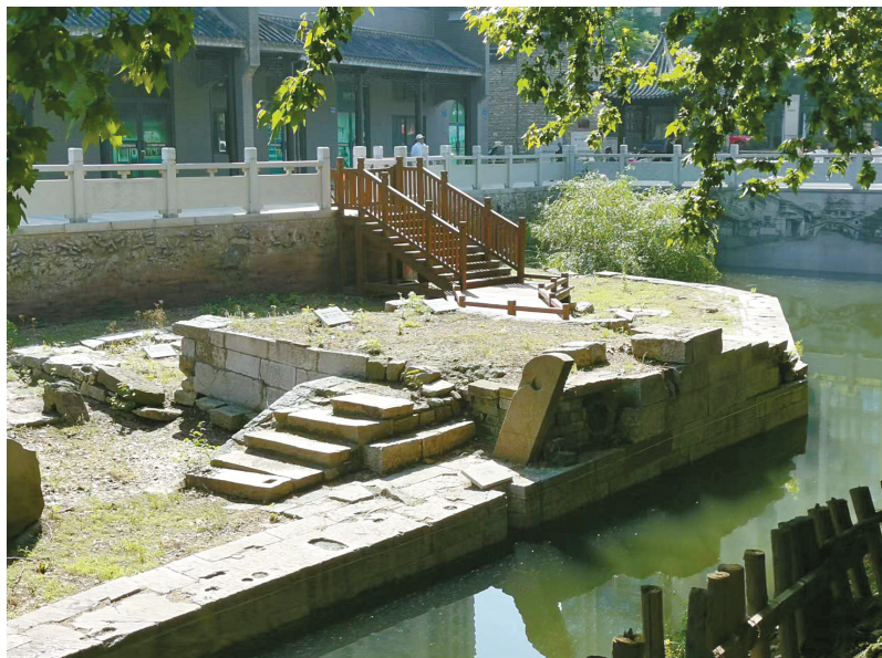
江南运河第一闸——京口闸遗址一角。