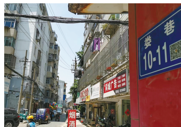
镇江大市口留有当年“委字记”巡铺印记的“委巷”。