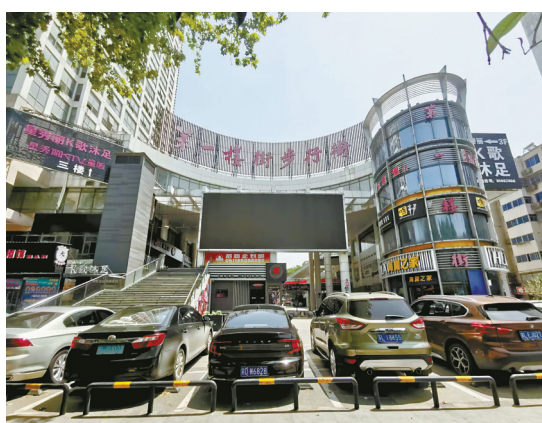
镇江第一楼街已改造为现代化商业步行街。