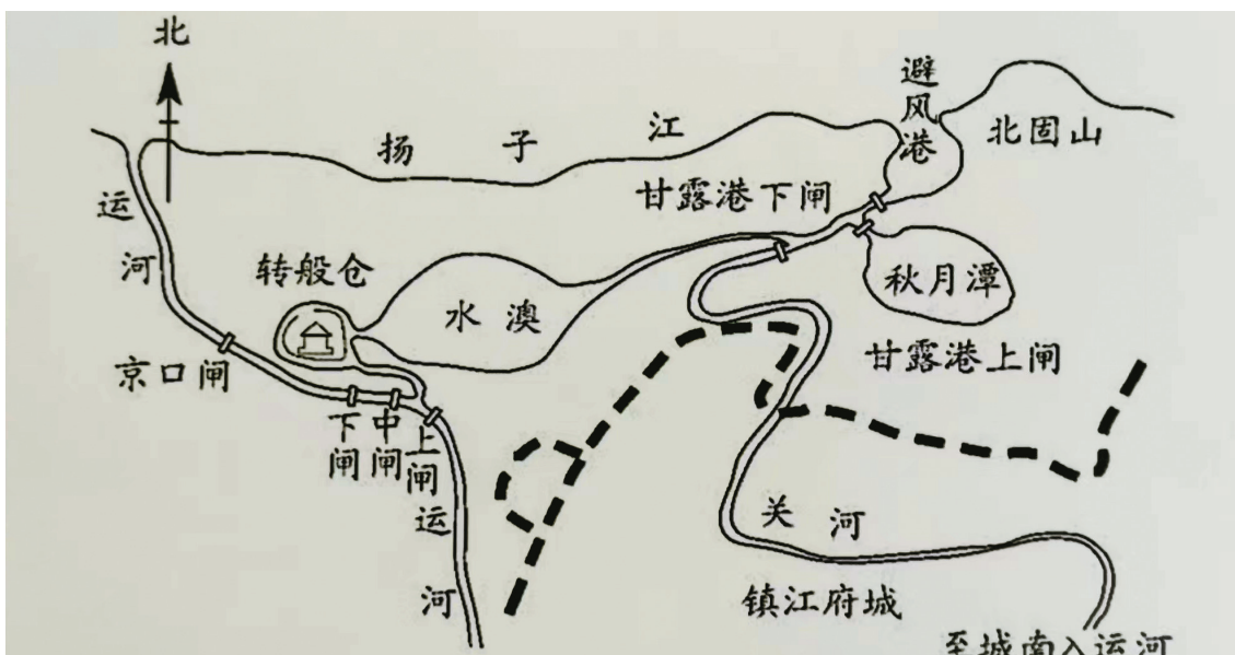
南宋嘉定十一年（1218年）京口澳闸布置示意图

喜雨楼，后来成为宋代文人宴集之所，颇有名气的李友山诗社诸诗人，曾在喜雨楼中以大鹏为赋，留下不朽诗篇。如今，历经800年风雨，喜雨楼已不复存在，留给人们的只有这个楼名了。镇江第一楼街也已改造为现代化商业步行街。与当年的喜雨楼一样，每到晚上，这里的酒吧一条街及夜市排档就成了镇江人聚会的地方，能一直热闹到凌晨，