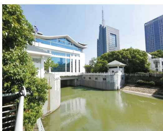
古运河上重建的京口闸。