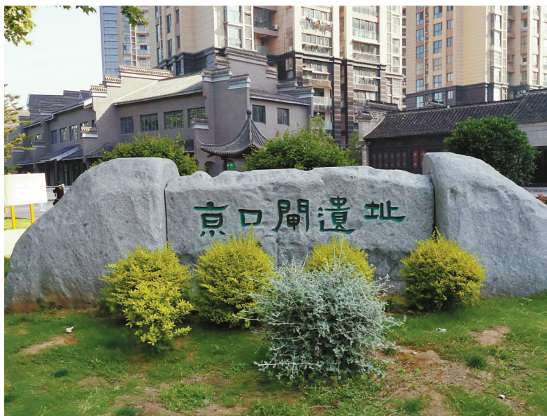
新建成开放的京口闸遗址广场。