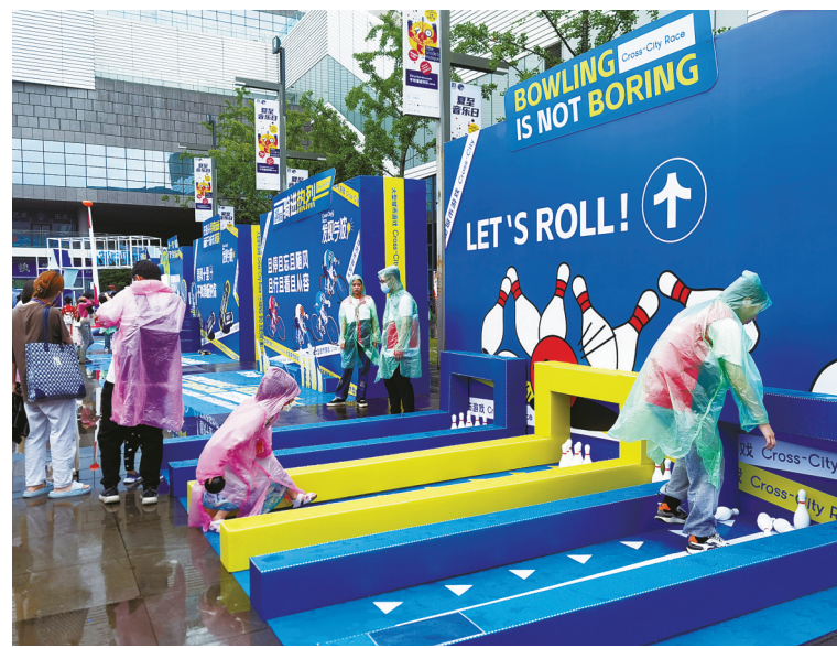
市民体验亚运同款项目。