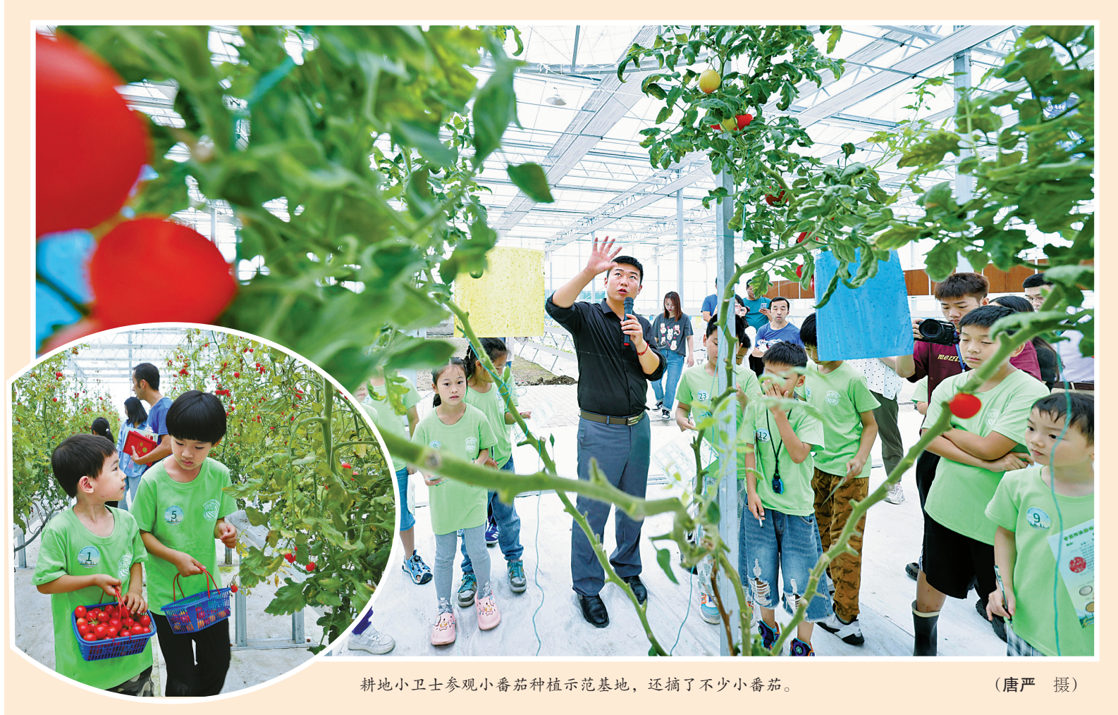
耕地小卫士参观小番茄种植示范基地，还摘了不少小番茄。