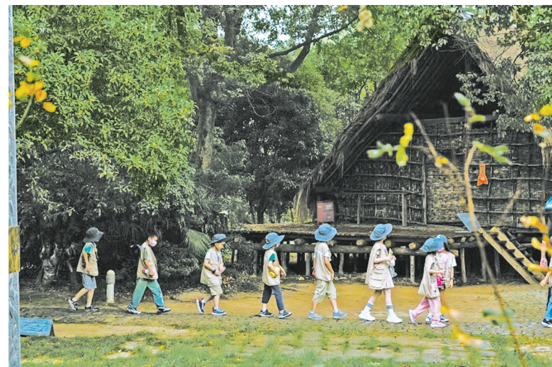
端午河姆渡研学游。