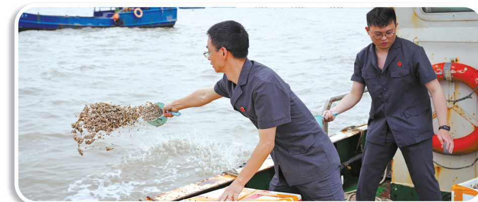
宁波海事法院法官会同嘉兴市自观局工作人员在杭州湾海域对油污事故受污染海域开展增殖放流活动，将1.4亿颗贝类苗种放入海。

至福建海域，使用浙江省明文禁止的禁用渔具电脉冲惊灯进行捕捞，捕获螃蟹、虾蚧、杂鱼等水产品，渔获物价值约168000元，并进行销售。