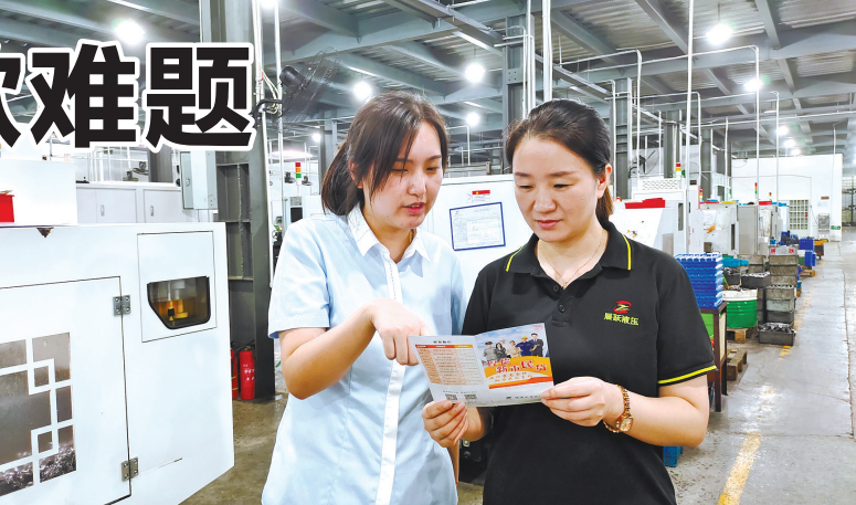
银行工作人员向企业负责人介绍纯数据授信产品。

与此同时，通过数据沙箱模式，“甬易贷”的相关数据只能通过模型结果形式对外输出，而且在使用前还需经过市民的在线授权，进一步确保数据的安全性。“简单来说，你可以把数据平台比作厨房，数据比作菜，相关机构通过厨房可以做菜，但无法将菜端出厨房。”忻犁说，数据沙箱模式确保“甬易贷”在数据加工的过程中，可用不可见。