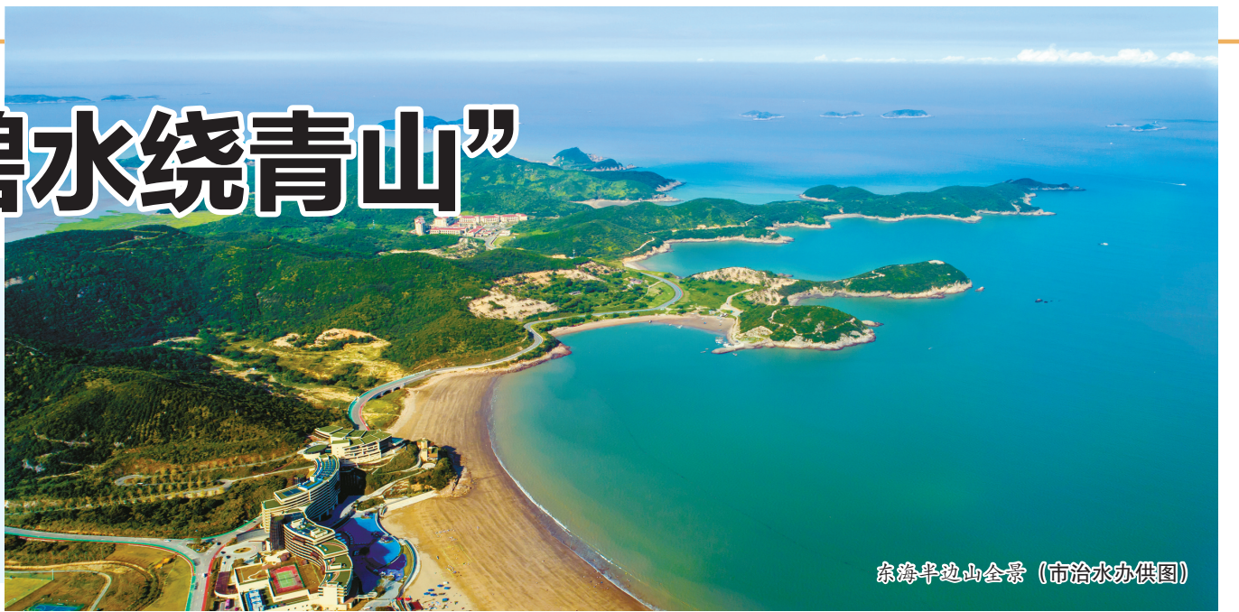
东海半边山全景

近年来，宁波始终贯彻落实上级部署要求，深入打好污染防治攻坚战，加快推进美丽海湾保护与建设，全市海洋生态环境持续改善，海水水质优良率稳步提升。去年11月，市美丽办发布《宁波市重点海域综合治理攻坚战实施方案（2022—