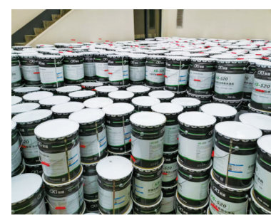
院子里堆放了大量防水涂料。

本报讯（记者石景）7月3日，编号为“7908058”的网友向宁波民生e点通群众留言板反映，江北区庄桥街道灵山村慈江里小区有人把几千桶的油漆放到小区房子里，现在天气这么热，万一爆炸怎么办？ 前天下午，记者前往慈江里小区，看到19幢3号房屋大门紧锁，但一眼就看到了院子里整齐堆放的大量铁桶。记者注意到，该房屋尚未装修，里面空无一人。 记者仔细看了下，这些铁桶为科顺K5520非固化橡胶沥青防水涂料，为装修材料。按照长度19桶、宽度13桶的方式堆放了3层多高，粗略估计数量约800桶。 记者绕着该房屋走了一圈，透过窗户看到，房屋内堆放了不少水泥砂浆和防水胶膜，均为装修材料。 记者从灵山村村委会了解到，慈江里小区（灵山嘉苑5期）为村