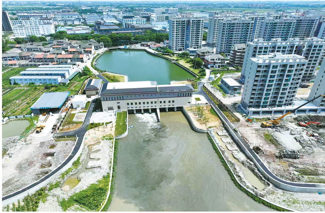
上水碓泵站俯瞰图。

“鄞江堤防整治工程全长16.9公里，去年6月30日实现主线封闭，形成一个较为完整的防洪封