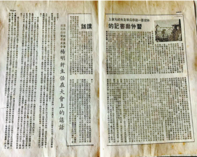
父亲收藏的毕业专刊中习仲勋的讲话。