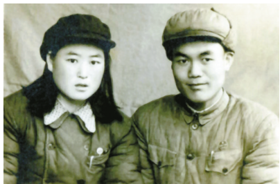
上世纪50年代初父母的合影。