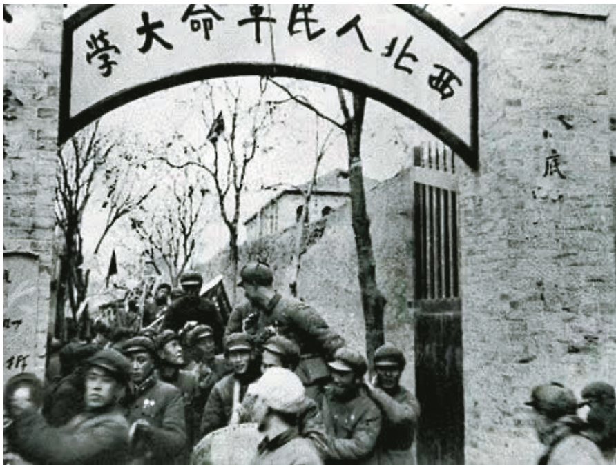
首届“西北民大”毕业生欢快地走出校门奔赴西北五省区。