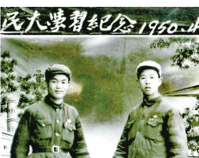
父亲(左)与“西北民大”同学的合影。

战争，而是和平建设，这个任务比战争的任务要艰难百倍……西北人民革命大学担任起了培养干部的任务，这是我们一个强大的政治兵团……目前，西北正在闹干部荒，处处都在喊要人……这是一个政治工厂，要锻炼大批的政治干部。”