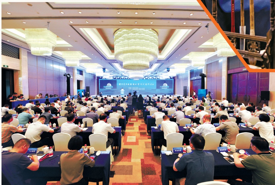
黄宗羲学术思想的当代价值研讨会会场

十三届全国政协常委、民族和宗教委员会主任，中国社会科学院原院长王伟光认为，探究黄宗羲学术思想对建设中华民族现代文明的启示和借鉴，意义重大而深远。当前，世界之变、时代之变、历史之变，正以前所未有的方式展开，我们需要从包括黄宗羲学术思想在内的中华优秀传统文化中汲取智慧、认清方向、走向未来。