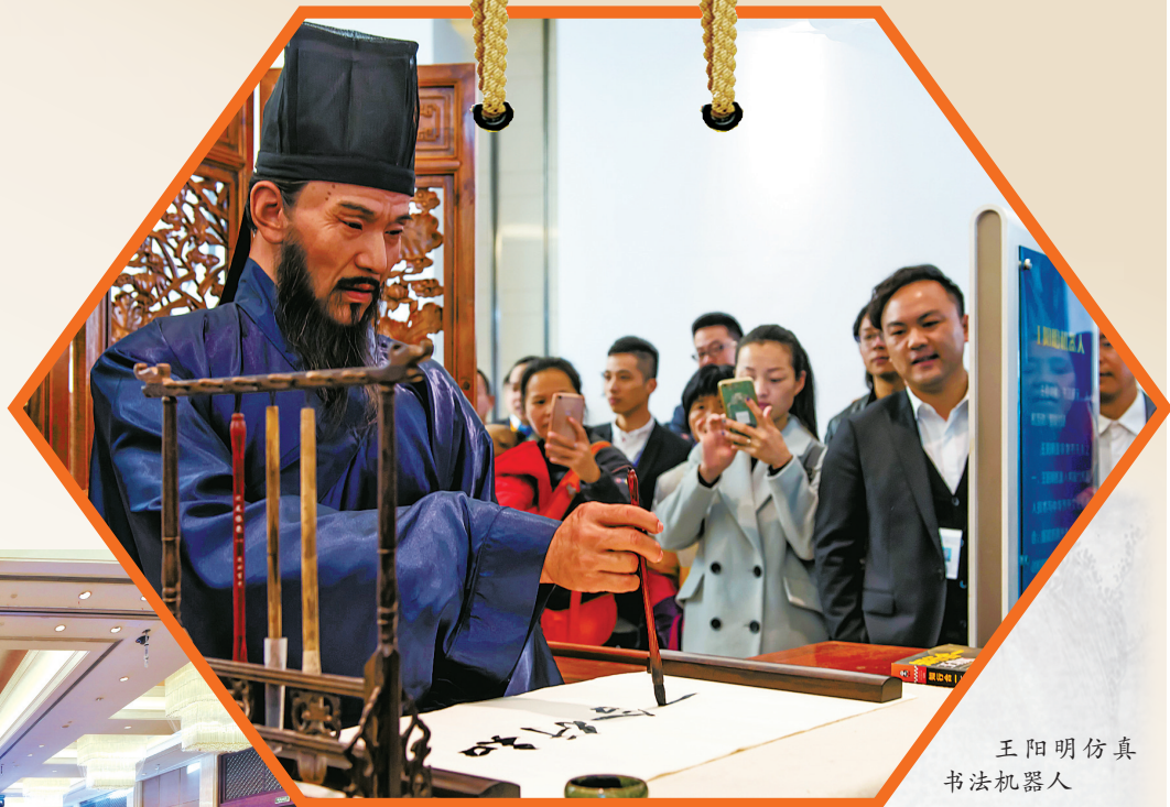
王阳明仿真 书法机器人

作为浙江历史文化名城，余姚深入贯彻习近平总书记任在文化传承发展座谈会上的重要讲话精神，担负起新的文化使命，努力建设中华民族现代文明。该市坚持把传承发展优秀传统文化作为城市发展的重要内容，深入打造城市文化印记和城市文化品牌，让厚重鲜明的传统文化浸润城市肌脉、提升城市形象。