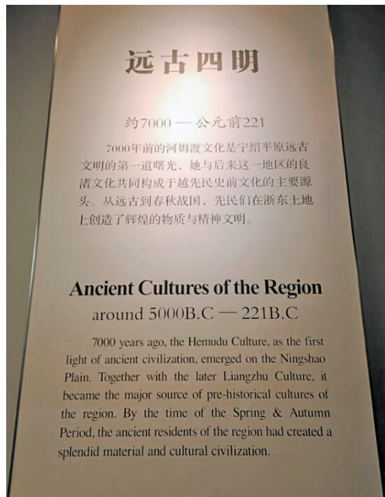
场馆内关于河姆渡遗址及句章故城介绍展板。

成果发布已过去3年多,为何馆陈仍未更新呢?昨天,记者前往宁波博物馆。正值暑期,馆内人潮涌动。在二楼宁波史展馆中,记者看到第一篇章为“远古四明”,以7000年前的河姆渡文化开篇,未