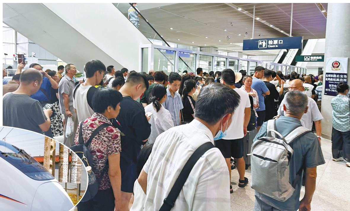
图为杭甬城际列车开通首日,城铁宁波站人潮涌动。

在此,宁波城铁发布客流预警,预计今明两天将出现客流高峰。届时,城铁宁波站7:27班次和杭州南站15:50班次会采取必要的限流措施,可能出现乘客无法上车的情况,建议广大乘客错峰出行或延后“尝鲜”。