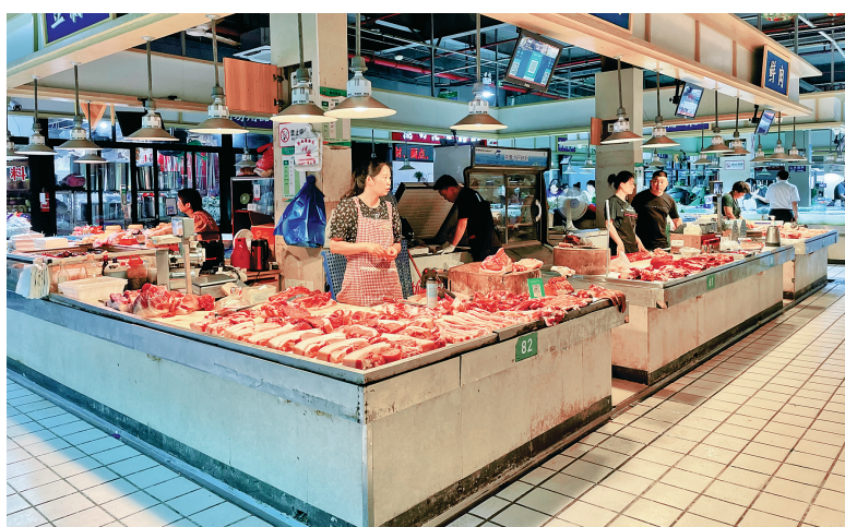
时代邻里农贸市场肉类交易区已挂上新灯具。

“换灯工作是从3月底开始的。这里共有100家肉摊位70盏灯,我们花了7000元为摊主换了灯。目前,经营户和群众的反映都