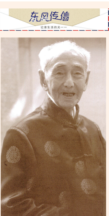
钟老和他的弟子们

2016年2月23日，因突发“脑血管意外”，钟老溘然离世，享年102岁。钟老的一生，真是勤奋的一生，济世的一生，清廉的一生，清醒的一生。甬上泰斗，当非一地之泰斗；医界楷模，实亦百界之楷模。