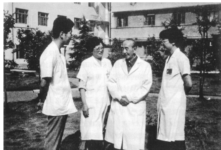
钟老和他的弟子们

势，又注重运用现代医学手段，是传承创新的典范。他反复强调：一定要充分发挥中医药的独特优势，中医医院一定要体现中医特色，中医药的生命力在于临床疗效，这是中医医生的立身之本，是中医医院的立院之本。他十分注重运用中医“望”“闻”“问”“切”四诊合参来测知人体五脏六腑的病变，而不是动不动就来一大串化验单，一方面提高了诊疗效率，另一方面也为病人节省下不少费用。钟老认为疾病是“标”而病体为“本”，因此在治疗上须标本兼顾，在祛邪的同时要注意扶正，保持正气三五分，若病体更虚者，则扶正重于祛邪。在遣方用药上，要因证立法，以法统方，掌握加减变化之严谨法度。他把中医辩证论治的精髓发挥到了极致。他常说，用药如同用兵，兵不在多贵在精。因此，他的处方格局在“君、臣、佐、使”原则之下，药味的数量尽量精简，每味中药的剂量也不大，用宁波话来说，就是“药头比较轻”。有时针对一些疑难沉疴，他也敢于施上几味猛药以收奇效，可谓精准用药的典范。对于当前一些地方一定程度存在的过度检查、过度治疗、过度用药，确属有益的警示。