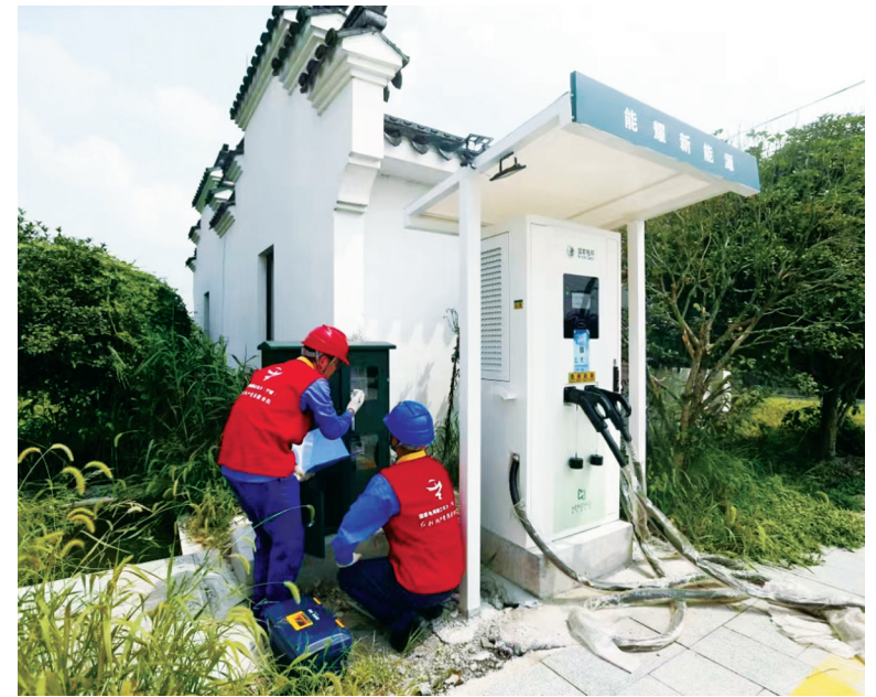
电力人员在安装充电设备。