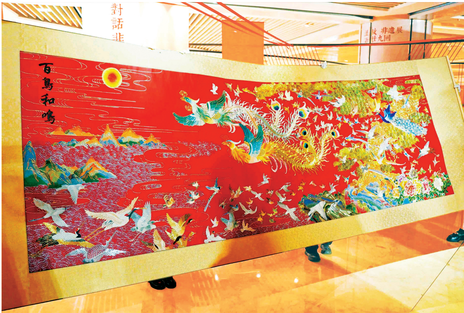
金银彩绣作品《百鸟和鸣图》。