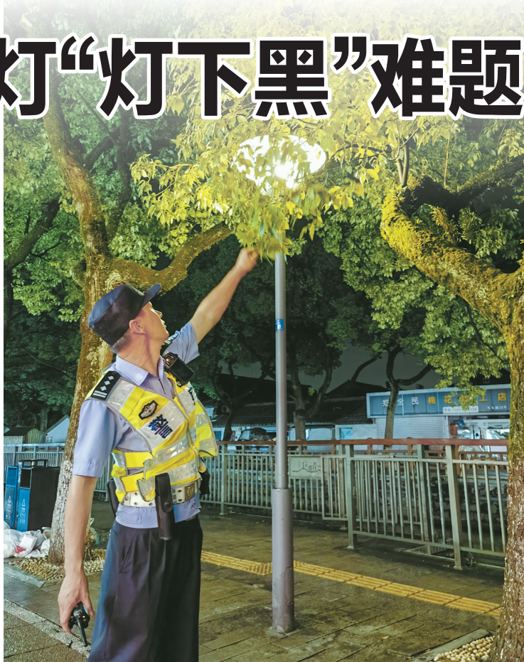
夜巡交警发现一处被树枝遮挡的路灯。

“真相”。 跟随王铝崩，我们来到了第二站——连接北环高架的庄马段。这是一条村道，通行条件不佳。驱车前进，发现有些路段照明不足，王铝崩时不时就下车查看，拍下短视频，配上文字，发到工作群里。 走走停停，来到压赛堰路与庄马段交叉口附近，他又发现了新问题：道路没有路灯的一侧，绿植过于茂盛，且雨后地面积水较为严重，存在安全隐患。“这种城乡接合部的道路，安全条件本来就差，如果照明不跟上，晚上出行是有风险的。我觉得这个地方还得加个路灯，已经把这个建议报上去了。”王铝崩说。 今年年初，江北交警大队顺势推出新的勤务机制。它改变了以往交警夜间值班“坐等”的模式，在安排好留守人员后，要求主动出击，其他警力上路巡查。夜巡同样是有规划有目标的，背后全靠全量事故分析机制支撑——即根据阶段性事故数据，哪个区域发生多，就重点巡查该区域。 “庄桥的三座桥——灵山河、阮家桥、横路陈公立立交桥，以前晚上是黑得伸手不见五指。夜巡交警发现上报后，现在都装上了灯带，安全系数一下子就上去了。还有甬江街道梅竹路的‘亮灯’工程，也是如此。”夜巡交警