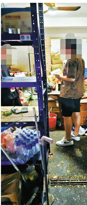
店内灶台油腻、加工食材随意摆放、散落、地面脏污，卫生状况堪忧。

购买的炒饭被打包后随意摆放在店门口的架子上，供外卖员领取。记者注意到，店内安装有摄像头，但该摄像头显然未与“饿了么”平台关联。 “食材都是新鲜现做的，锅每次都会洗，不然炒饭会糊掉。其他事情我们实在顾不上。”一名店员这样说。他还告诉记者，自己是新手，经过简单培训后上岗。店里平时订单较多，到了就餐高峰期更是手忙脚乱，疲于应对。但晚上下班前，他们会将店铺打扫干净，做到“每日一扫”。 一如网友反映，记者发现，该集贸市场目前进驻了50多家外卖店。其中，有一些店铺同样存在地面油腻、污水乱倒、货物杂乱等情况。 一家月销量900多单的炸鸡店虽然开通了“阳光厨房”，但门口有污水，店内设备和灶台油腻，有网友评论“买了个鸡翅包饭，竟然是臭的”；另一家月销量1000多单的地锅鸡店未开通“阳光厨房”，里面同样存在脏乱差问题。有网友评论“吃了几口后上吐下泻，身体难受，剩下的都没吃”。 镇海区市场监管局庄市工商所相关工作人表示，关于从事外卖业务，他们现在有如下规定： 首先，从业者需本人到所里提交身份证、房产证复印件和房屋租赁合同，并进行实名认证。如果只是经营热菜，只需厨房即可，但如果经营冷菜，需将冷菜（熟食）加工区与生食加工区分开。在办理完营业执照后，经营者才可到外卖平台登记注册网上外卖店铺。 其次，根据《浙江省电子商务条例》相关规定，网络餐饮商户需在后厨安装视频监控摄像头，实时公开食品加工制作现场。若没有安装，首次发现的，将责令整改；再次发现的，处200元至500元罚款；多次发现的，将被吊销营业执照。经营者在办理营业执照现场登记时，该所可提供移动、电信、联通三家运营商的安装联系电话，目前对首次安装和产生的流量费都有补贴，每年约480元，无需经营者缴纳。 针对网络餐饮“阳光厨房”不规