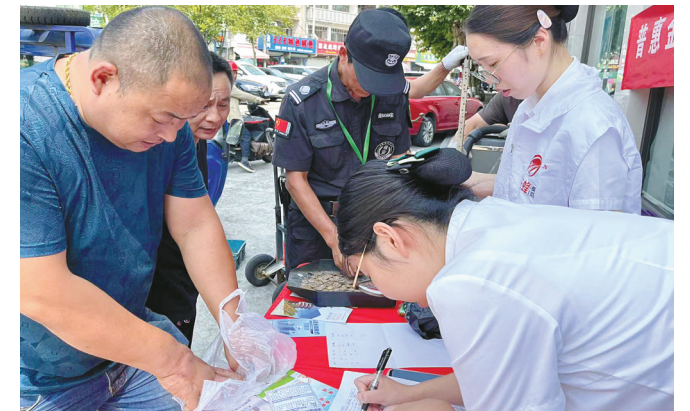
图为鄞州银行员工为有硬币兑换需求的商户和个人提供兑换服务。