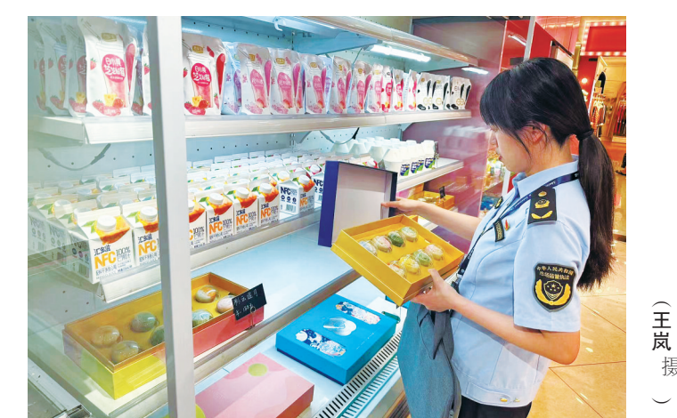
执法人员正在检查月饼礼盒。

接与内装物接触的包装之外，所有包装成本不超过售价的20%，售价100元以上的月饼，包装成本不超过售价的15%。 对于企业比较容易“犯规”的包装空隙率问题，新标准也有明确规定：如月饼重量大于50克的，空隙率不能超过30%。此次被查的月饼，经现场检测，包装空隙率均大于40%。 此外，月饼不应与红酒、茶叶、刀叉等其他产品混装，必要时可放入食品用脱氧剂、冰袋等防止月饼变质的产品。 截至目前，全市市场监管部门已出动执法人员1702人次，检查相关经营者1074家。 检查结果发现，今年大多数月饼包装已实现“瘦身”。比如往年的月饼礼盒基本由外盒、内里独立小盒和月饼料包装袋组成，如今大部分月饼礼盒除外盒外，月饼直接由塑料包装袋通过纸托嵌入礼