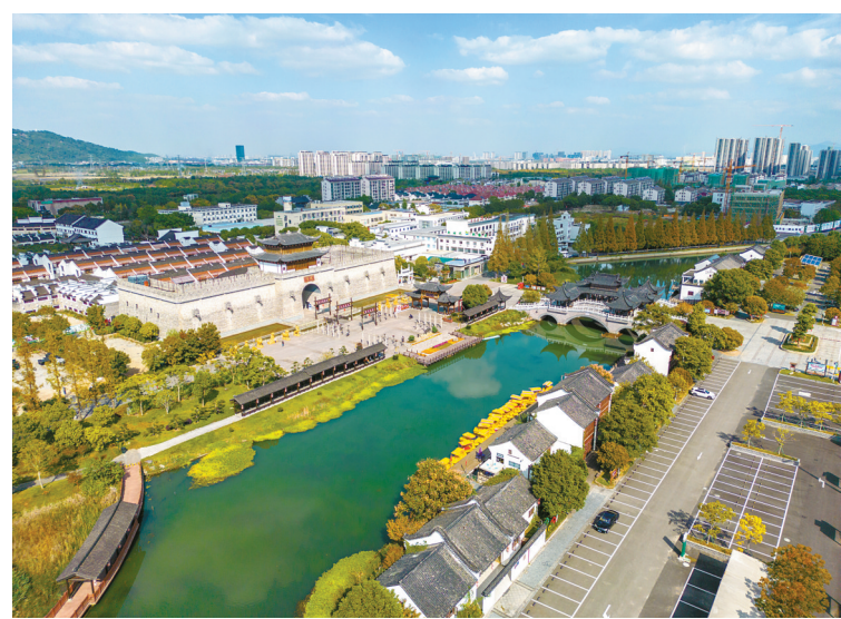
滕头村一景。

“一犁耕到头，一任接着一任干”的滕头村经验，将给正在实施乡村振兴战略的广大农村，带来有益的启迪。