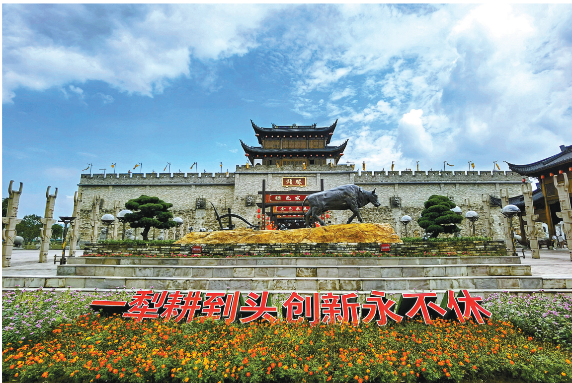
滕头村“一犁耕到头 创新永不休”的标语。

一是方向明确。牛耕田，要耕得好，就要笔直向前走，中途走走停停、弯弯绕绕，是耕不好田的。干事业也是如此，方向是灯塔、方向是指针，认准了方向，就要坚持不懈地走下去。上世纪60年代“改土造田”，有人认为要完成是“老虎天话”（不可能的事），在改革开放初期，要不要继续走发展集体经济道路也曾出现争议。滕头村党组织引导村民形成共识，只有“改土造田”，才能拔掉穷根；发展集体经济，