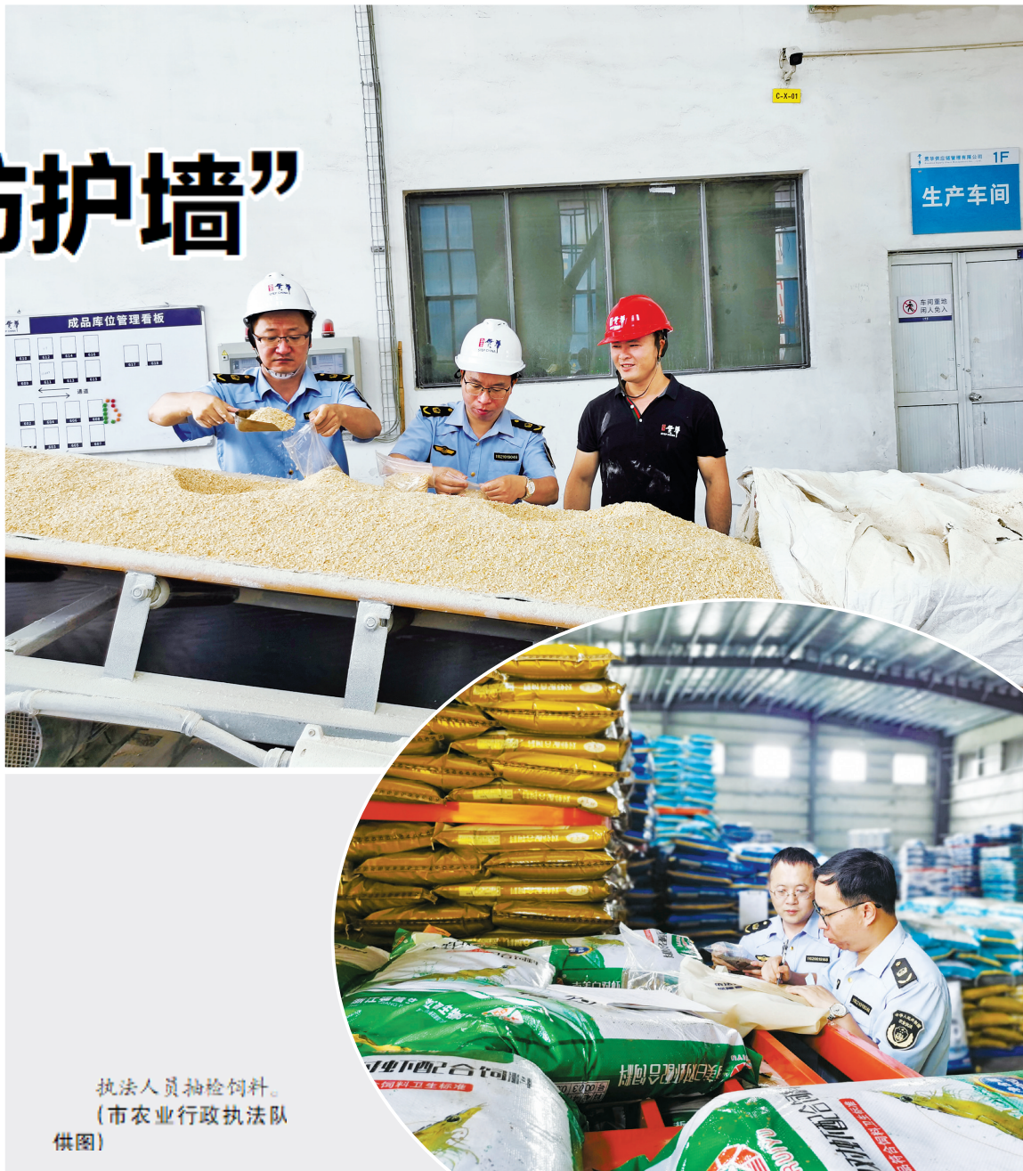
执法人员抽检饲料。

豇豆生产环节重点查处克百威等11种禁用农药使用违法和灭蝇胺等7种常规农药残留超标等问题。蛋禽养殖环节重点查处违法使用禁用药物和产蛋期不规范用药等问题。屠宰行业执法检查按照“三个全面”的要求，通过日间巡查、夜间突查等方式，重点检查屠宰环节畜禽调运备案、检验检疫、无害化处理等各项制度落实情况，全面