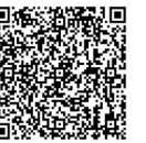
扫描二维码，观看完整视频

下一步，金投控股集团将牢牢把握改革机遇，开创国有金融资本管理新发展格局，全力推动我市金融业与实体经济高质量发展，全力打造“具备影响力的现代化金控集团”，为我市加快建设现代化滨海大都市、打造中国式现代化的市域样板贡献国企力量。