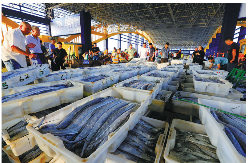
民生银行打造特色小微金融，助力宁波渔民致富。

息、手机号、身份证即可在线申请、审批、提款，最快5分钟知晓额度，授信额度最高300万元，期限最长5年，随借随还，支持多种还款方式，为小微企业带来融资服务全新体验，真正实现“民生惠，惠民生”。