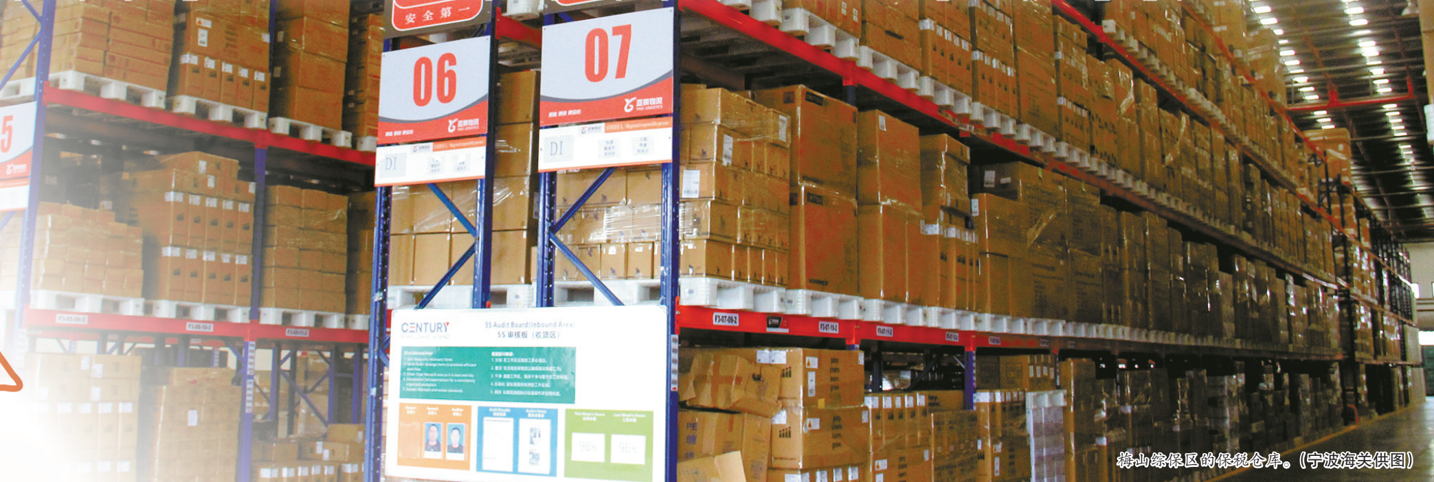
梅山综保区的保税仓库。