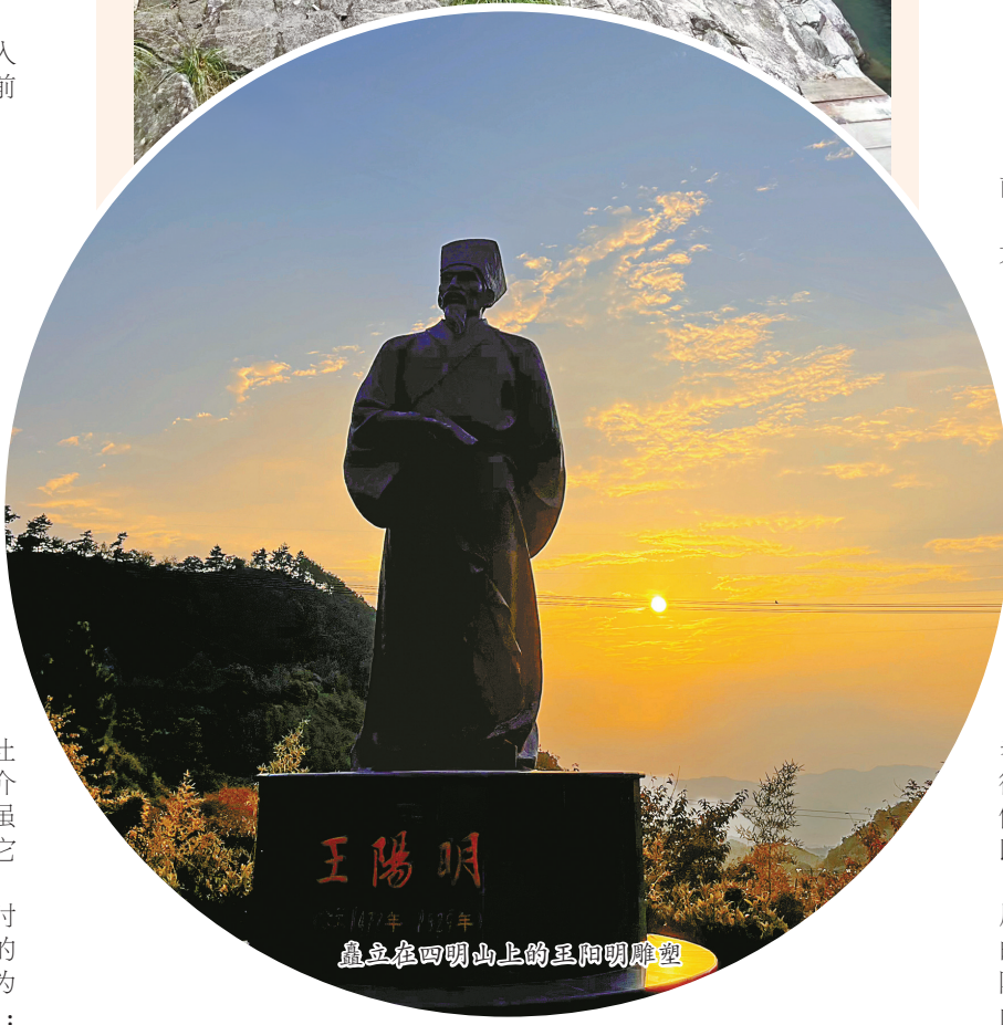
矗立在四明山上的王阳明雕塑