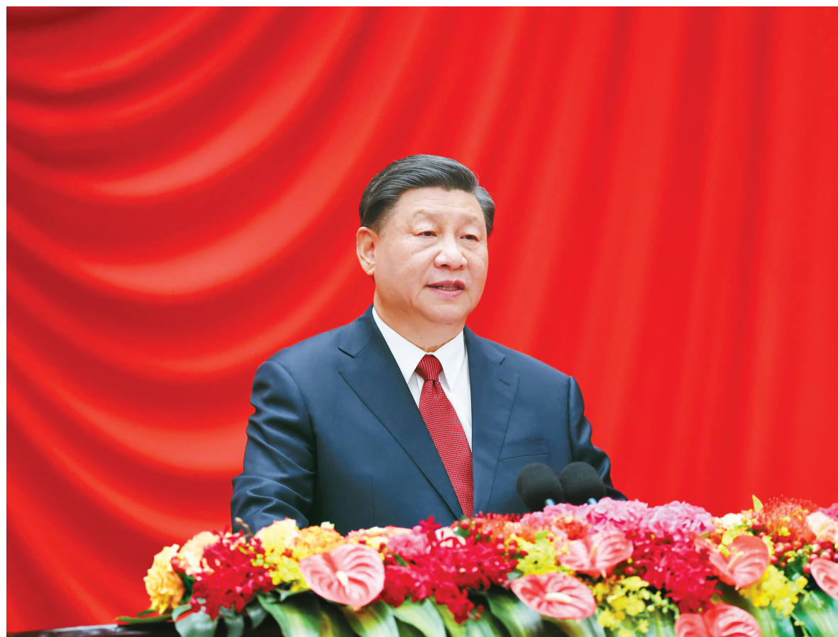
9月28日晚，庆祝中华人民共和国成立74周年招待会在北京人民大会堂举行。中共中央总书记、国家主席、中央军委主席习近平出席招待会并发表重要讲话。

习近平强调，当前世界百年变局加速演进，国际环境发生深刻变化，我们前进道路上还面临很多风险挑战。我们要围绕推动高质量发展，完整、准确、全面贯彻新发展理念，加快构建新发展格局，着力加大宏观调控，着力扩大国内有效需求，着力激发经营主体活力，不断推动经济运行持续好转、内生动力持续增强、社会预期持续改善，切实防范化解重大风险，努力实现全年经济社会发展目标。我们要围绕推进高水平对外开放，继续全面深化改革，稳步扩大规则、规制、