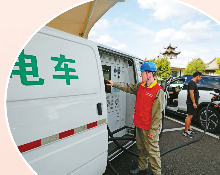
在慈城高速服务区，国网宁波供电公司工作人员正在指导车主使用移动充电桩进行充电。