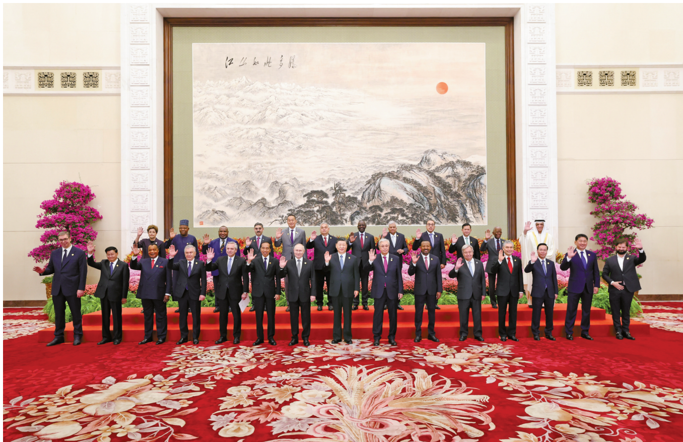
10月18日上午,国家主席习近平在北京人民大会堂出席第三届“一带一路”国际合作高峰论坛开幕式并发表题为《建设开放包容、互联互通、共同发展的世界》的主旨演讲。