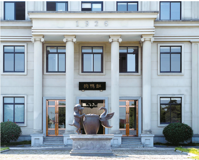
缸鸭狗位于镇海区九龙湖镇的工厂。

改变是水平；好的东西，不变亦是水平”。缸鸭狗管理层认为，传承就是在尊重传统的基础上因时制宜，勇于创新。