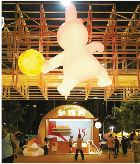
缸鸭狗参加产品推介活动。