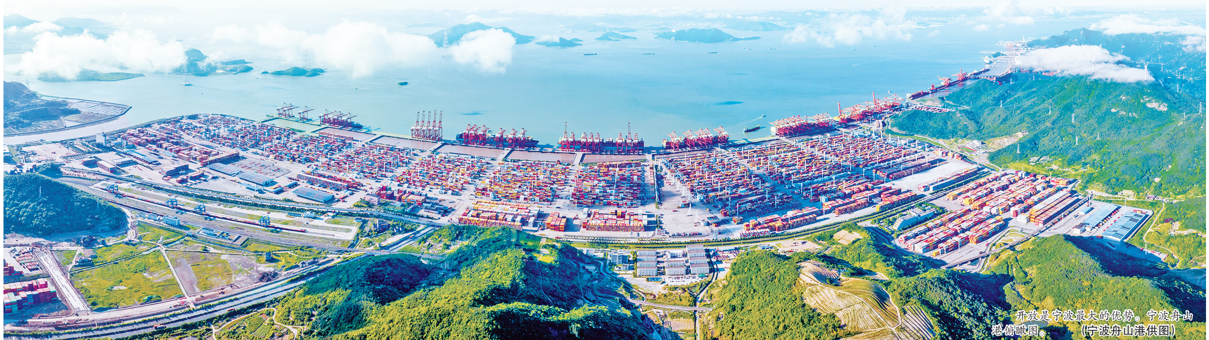
开放是宁波最大的优势。宁波舟山港俯瞰图。

超前谋划打动了对方，项目投资快速谈成，年内就将动工。 “新朋友”纷至沓来，不少“老朋友”也常见常新。 宁波进一步建立健全外资企业常态化沟通交流机制，通过召开全市外资企业圆桌会，落实企业反映问题闭环管理机制，目前已对34条问题诉求进行限时闭环“销号”。 另外，围绕优化外商投资环境、提高投资促进服务水平，我市开展外商投资企业服务月活动，集中推进解决一批企业经营发展中的卡点难点。 与此同时，我市持续推进重点外资企业“一对一”挂联。今年以来，市、区两级走访调研企业120余次，协调解决28个外资企业生产经营中的问题，挖掘了一批外资企业增资扩产和“以企引企”的项目信息。 兴办157个项目(分支机构)，投资总额262亿美元。 不只是“制造+制造”，越来越多的投资者将“制造+宁波服务”“制造+宁波新政”玩出了新的“CP感”(很般配的感觉)。 比如，宁波外资“26条”刚刚落地，前期摸排、调研工作早已先行一步。 世界医药巨头默沙东原计划投资6000万美元，在宁波新增一条动物保健品生产线，后因综合投资收益未达到全球总部的审批标准搁置了。宁波外资“26条”出台后，市投促署工作人员第一时间将喜讯告知，企业方面喜出望外，对相关条款频频点赞，表示新政大幅提振了企业投资信心。 据悉，今年前三季度，宁波制造业实际利用外资16.2亿美元，同比增长128.7%，超过2021、2022两年总量，占比38.8%。 “除了落实一批，还要储备一批。”市投促署有关负责人介绍，截至目前，全市有5000万美元以上在谈重大外资项目26个，总投资71.6亿美元。 稳外资、引外资，宁波一直在路上。