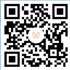
扫码观看 绵阳城市宣传片