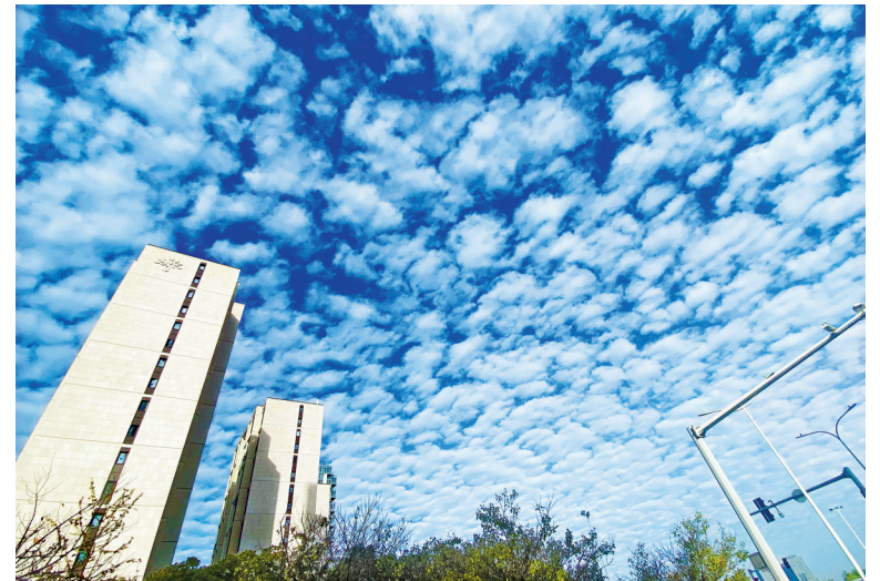
宁波上空的透光高积云。

民间有“天现鱼鳞云,不雨风也颠”的说法,出现这种云彩,是冷空气到来前,云层逐渐压低、加厚,由于高层气流不稳定,形成“鱼鳞云”,之后往往会下雨。据市气象台预测,11月4日开始有冷空气南下,预计4日至5日有弱降水过程,5日至6日气温有明显的下降。