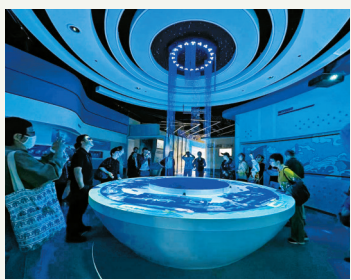
网友在水科技馆内参观。

据了解,市水务环境集团以再生水为核心,创新打造“再生水补水-水质生态改善-河道自然提升”这一水环境综合治理模式,通过新建再生水管道,多点位实施城市内河再生水生态回灌,带动受灌河道水体流动,加快水体置换速度。同时结合浮水、挺水、沉水植物等生态修复植物配置,丰富水面景观,实现水环境综合治理目标。和傅家畚河一样,鄞州区陆家河也通过同样的方式改变了水质。未来通过管线配套,将有更多的再生水回灌,展现水清河畅、鱼翔浅底的美丽生态图景。