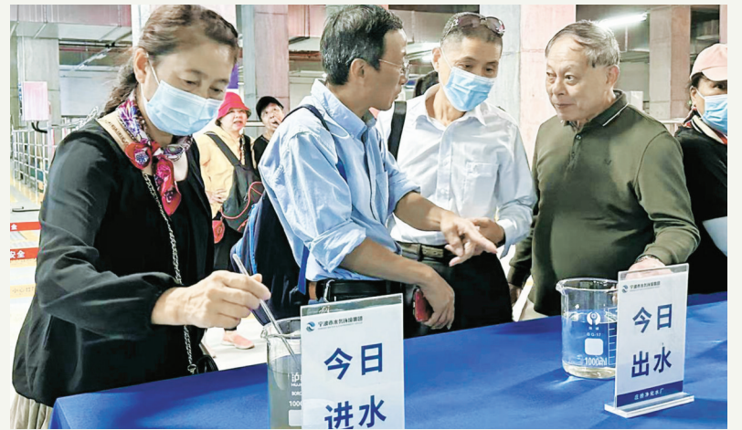
网友查看庄桥净化水厂“今日进水”和“今日出水”。 成可以再次使用的‘再生水’。出来准最高的,真正做到了让‘污水’变‘清水’。”

网友在现场见到两瓶水,一瓶为黑乎乎的进厂水,另一瓶则为清澈的出厂水。工作人员介绍:“我们的污水经过‘预处理’‘高效生化处理’和‘深度处理’三大环节,最终变