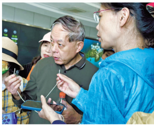
网友拿到了“超滤膜丝”。 网友参观桃源水厂超滤膜车间。