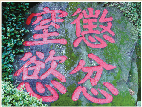
镇海梓荫山“慈悲空欲”四大字摩崖。

宁海县境内多山脉，摩崖分布广泛，数量居宁波之首，质量也较高，仅宋元时期摩崖就有十余处，占据了宁波宋元时期摩崖的半壁江山。其中刻于南宋庆元二年（1196年）的石台山联句摩崖，是宁波境内文字数量最多的一块南宋时期摩崖。刻于南宋绍熙四年（1193年）的天门山摩崖，为宁海南宋时期名人刘俊撰并书，它是宁波唯一刻有凿刻工匠名的摩崖。刻于南宋嘉熙四年（1240年）的阙风山香岩铭摩崖，为南宋丞相叶梦鼎所书，极具史料价值。宁海境内还有邹山岩画、长岩岭岩