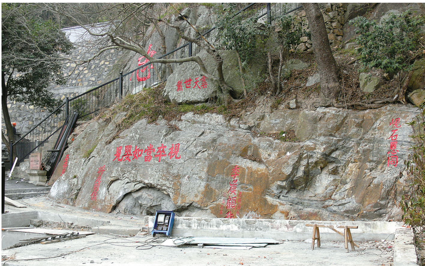
象山县石浦镇二湾摩崖群。