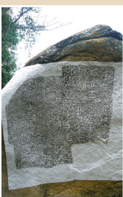
刺桐所书，右侧是北宋时期所刻。