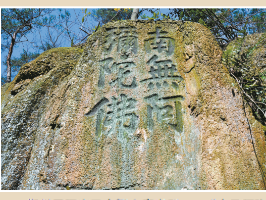
鄞州区阿育王寺鄞山摩崖群——“南无阿弥陀佛”六字摩崖。