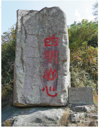
海曙区章水镇杖锡村屏风岩“四明山心”四字摩崖。