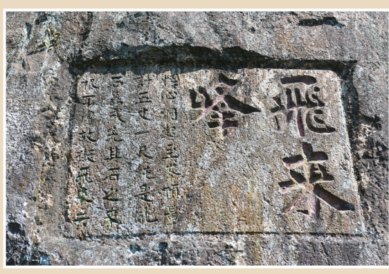
鄞州区天童森林公园飞来峰摩崖群。