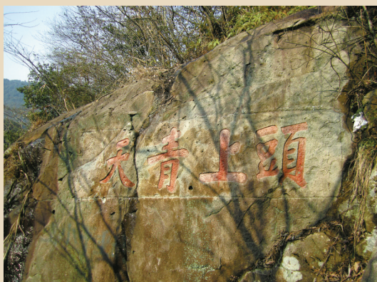
宁海县新岭“头上青天”四字摩崖。

梓荫山西麓的“日涉成趣”4字摩崖，是民国廿五年（1936年）冬独立第三十七旅旅长陈德法所题，其当时奉命来宁波镇海，率部参与宁波沿海的佛采尔宁波防守计划工事的建造及负责海防。