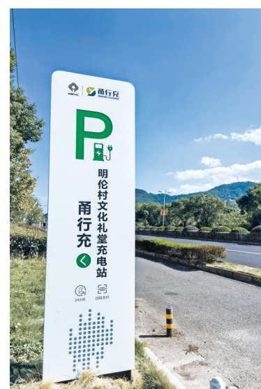
图为明伦村公共充电站。

根据计划，至今年底，该区还将完成宁波书城、鄞州区文化艺术中心、鄞州区政府西侧、鄞投大厦、宁波东高速出口、甬江4号地块等10个停车场275个充电泊位的建设安装工作。