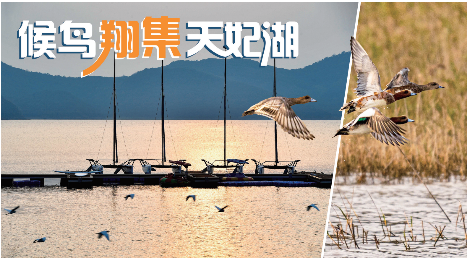
这两天,在奉化区裘村镇天妃湖,上万只“小可爱”成为游客争相拍摄的主角,斑嘴鸭、绿头鸭、鸳鸯、灰鹭、海鸥等20余种鸟儿汇聚于湖面,或嬉戏追逐,或在觅食,形成一幅“万鸟共舞”的绝美画面。天妃湖与象山港为邻,随着这一区域环境质量不断改善,优良的栖息条件吸引了越来越多候鸟前来过冬。

重实践,建新功。在“六促六优”大场景下,今年北仑区30个重大项目已开工建设,其中梅山国际冷链平台、北仑电厂一期节能减排改造等多个重大项目取得突破性进展。