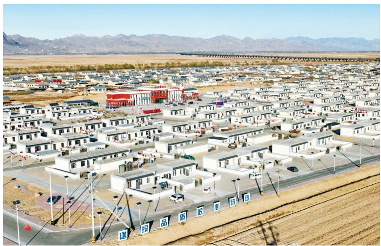
回家吃旦新村（11月9日摄，无人机照片）。11月20日，回家吃旦新村最后28套安置房钥匙交到群众手里，标志着内蒙古自治区迄今最大的黄河滩区迁建项目宣告成功。