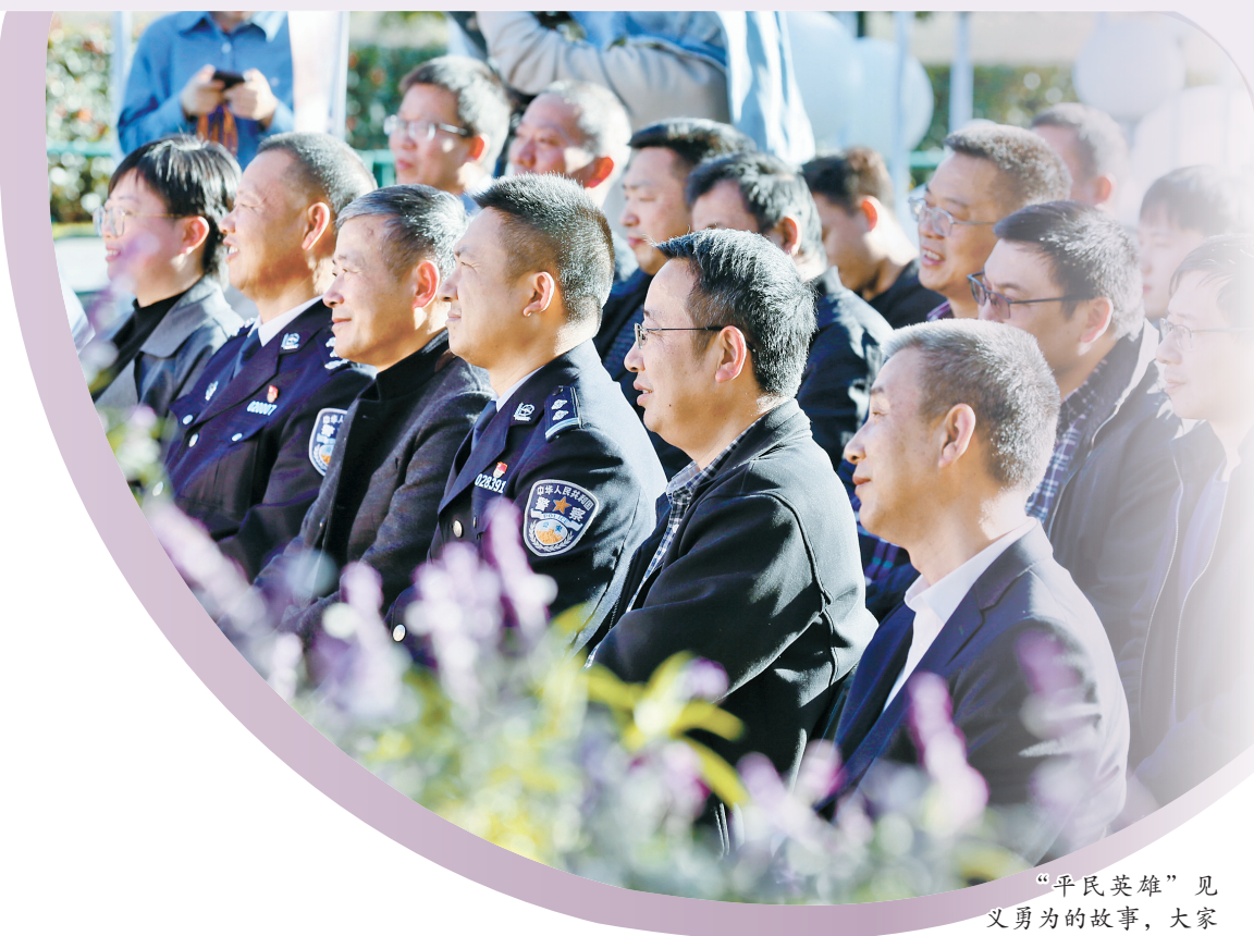
“平民英雄”见义勇为的故事，大家都爱听。