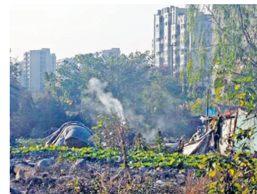
▲现场正在焚烧树枝。 ▶空地上垃圾堆积。