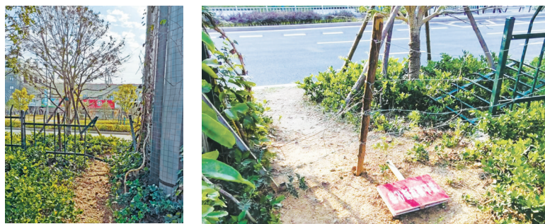
风华路绿化隔离带中支离破碎的护栏。

“今天在《宁波日报》“e眼关注”专版上看到《部门回复质量如何请您一起“挑刺”与“点赞”》一文后，我自然而然想起自己曾经投诉的一处城市“伤疤”。数月过去，如今有否治愈？便又去“故地”重游，看看回复质量究竟如何了。但到达现场后，失望又唏嘘——涛声依旧。”11月15日，网友“梓荫山1960”在宁波民生e点通群众留言板上发帖感叹。