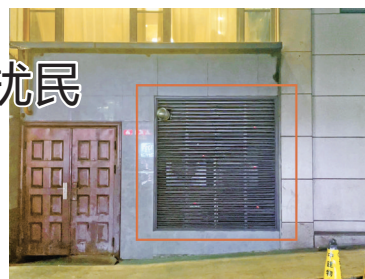
麒麟大厦南楼底部发出噪声的空调外机。