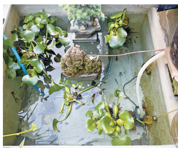
有人在该单元门口挖鱼池。