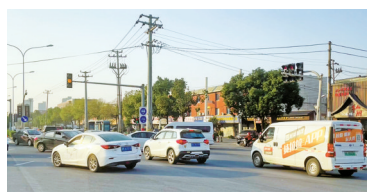
由于未设置左转弯信号灯，该路口部分左转车辆给直行车辆带来一定阻碍。

6月21日，网友“yyyf”发帖建议，在鄞州区五乡西路龙兴路口，自五乡西路左转进入龙兴路的车辆较多，由于和直行车辆抢道，造成路口拥堵。严重时，即便等到下一个绿灯亮起，直行车辆依然不能通行。建议在此设置左转弯信号灯，避免抢道。