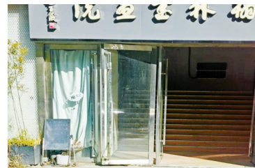
消防通道边花店未见拆除。

9月25日，网友“胡萝卜118”发帖投诉，鄞州区联盛广场B区两个消防通道被租户私自占用，一个通道两侧成了杂物间，十分脏乱，另一个则被私自隔了一家花店。业主已多次向物业公司反映，都不了了之。