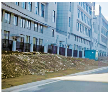
道路边土堆依旧。