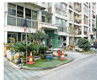
钱湖人家二期64幢131单元门口草坪被毁坏。

11月20日，记者在钱湖人家二期看到，64幢131单元门口大部分绿化被毁，有人在草坪浇筑混凝土、铺设人工草坪、修建鱼池和摆放石桌、石凳。此外，该小区还有多处绿化被毁。