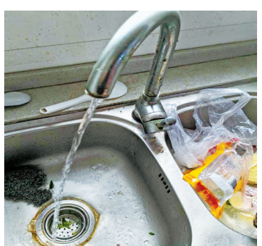
横溪商会人才公寓水龙头出水小。