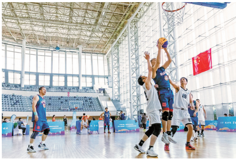
第二届全民运动会三人制篮球比赛。