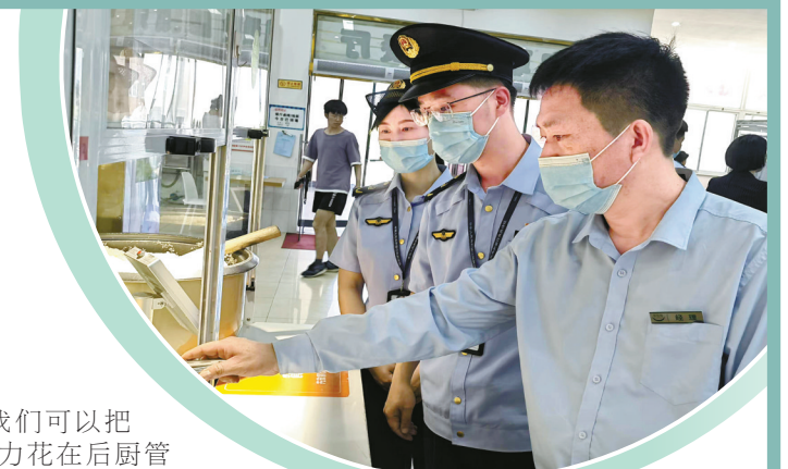
执法人员检查学校食堂。

近期，浙江省第一批16个市场监管部门助力共同富裕示范区建设创新模式培育项目公布，北仑区校园食安“四色健康码”智治新模式入选。这个模式将在进一步深化后向全省乃至全国推广。