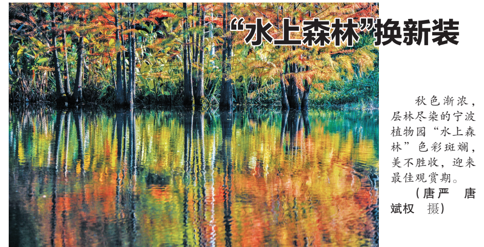
秋色渐浓，层林尽染的宁波植物园“水上森林”色彩斑斓，美不胜收，迎来最佳观赏期。

市住建部门提醒，经审核符合条件并取得准购资格的申请家庭只能购买一套共有产权住房。已购买低收入家庭住房、经济适用住房或限价房等保障性住房的，不得申请购买共有产权住房。