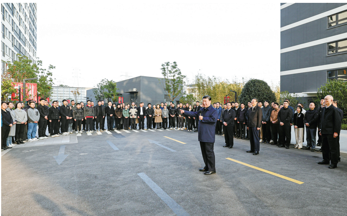
这是11月29日下午，习近平在闵行区新时代城市建设者管理者之家，同社区居民亲切交流。