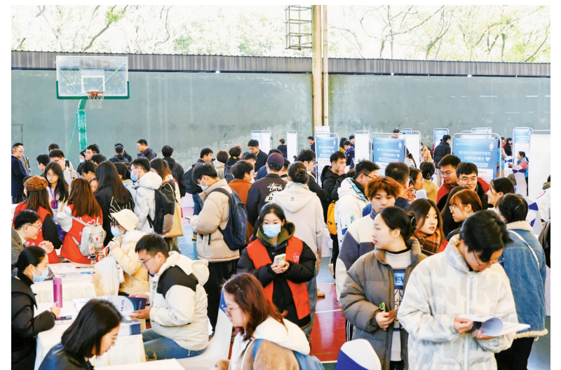
招聘会现场。

本报讯(记者杨绪忠 通讯员沈妙辉)昨日上午,浙江省2024届高校毕业生宁波专场招聘会在宁波大学举行,来自全省近5000名应届毕业生前往寻找就业机会。