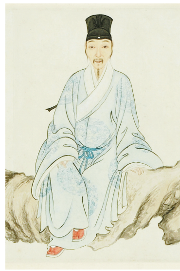
清 佚名 《张苍水画像》(局部)