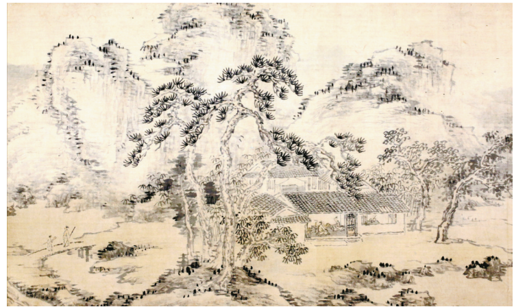
清 黄宗炎 《村东水榭图》(局部)