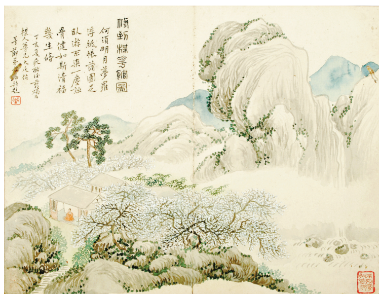
清 顾春福 《修到梅花馆图》