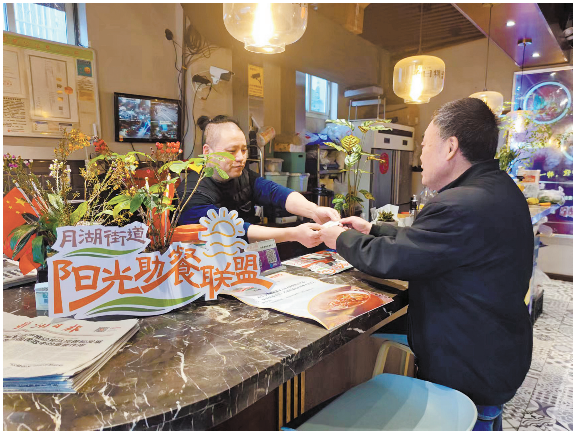
月湖街道居民在“阳光助餐联盟”单位消费。

记者看到,在首批“阳光助餐联盟”单位名单中,有五星级酒店、精致日料店、川菜馆、大食堂、快餐店等,提供自助餐、