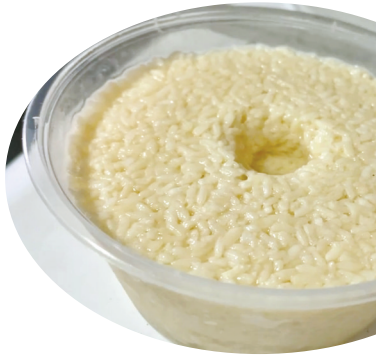
刚制成的酒酿。

本报讯(记者许天长 通讯员叶晶晶)今天我们迎来了大雪节气。大雪节气的到来意味着天气越来越冷,宁波真正“入冬”的脚步也越来越近了。