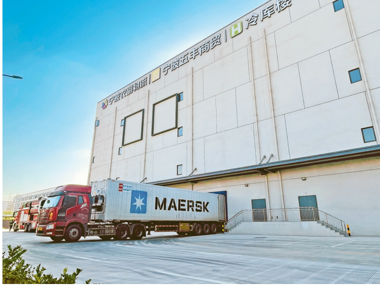
图为冷库外观。

值得注意的是,到库车辆还可与各大冷库的月台实现“无缝对接”,叉车能直接开进卡车车厢,极大地提高卸货效率,缩短货物入库等待时间。