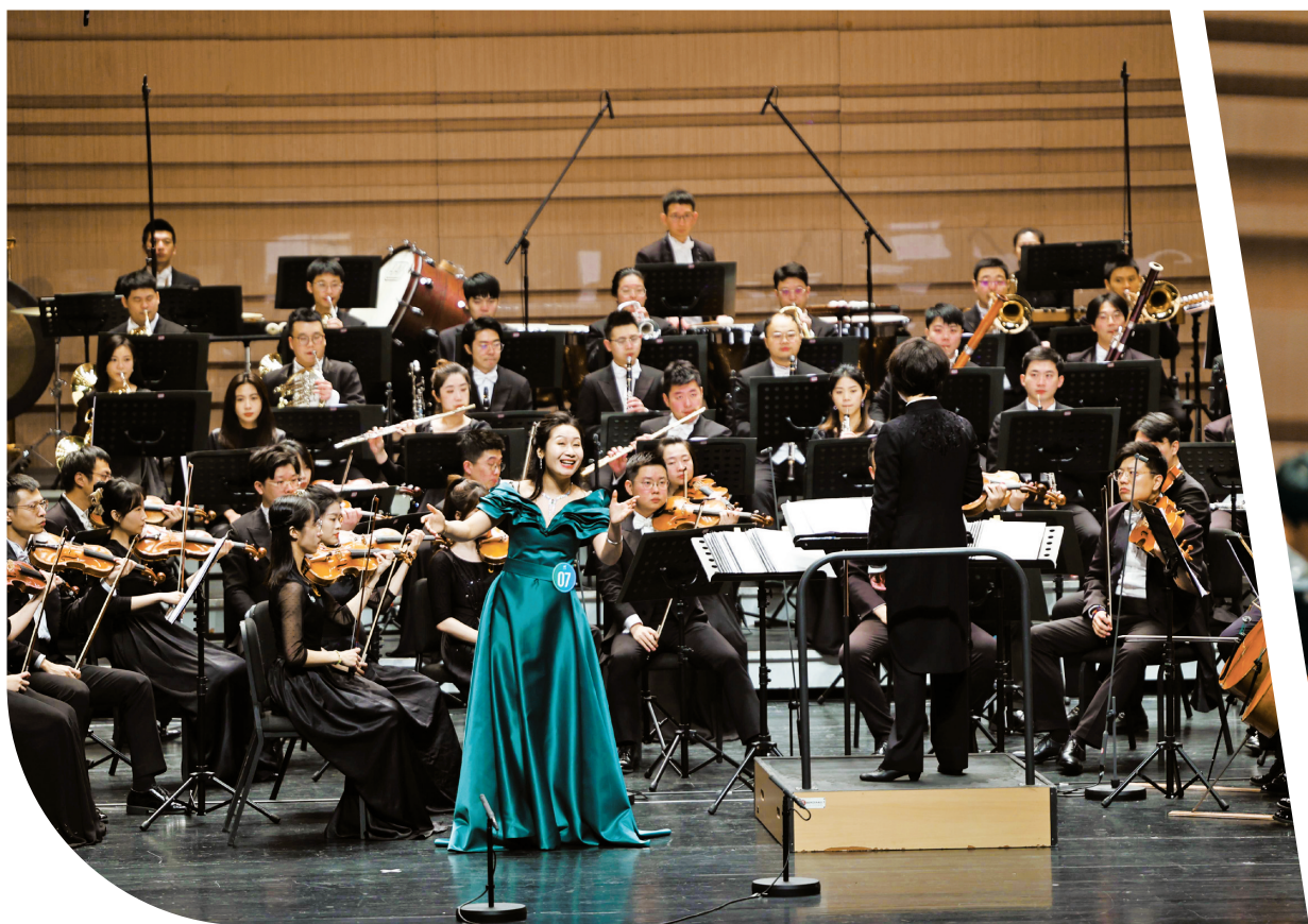
2023 宁波国际声乐比赛现场。