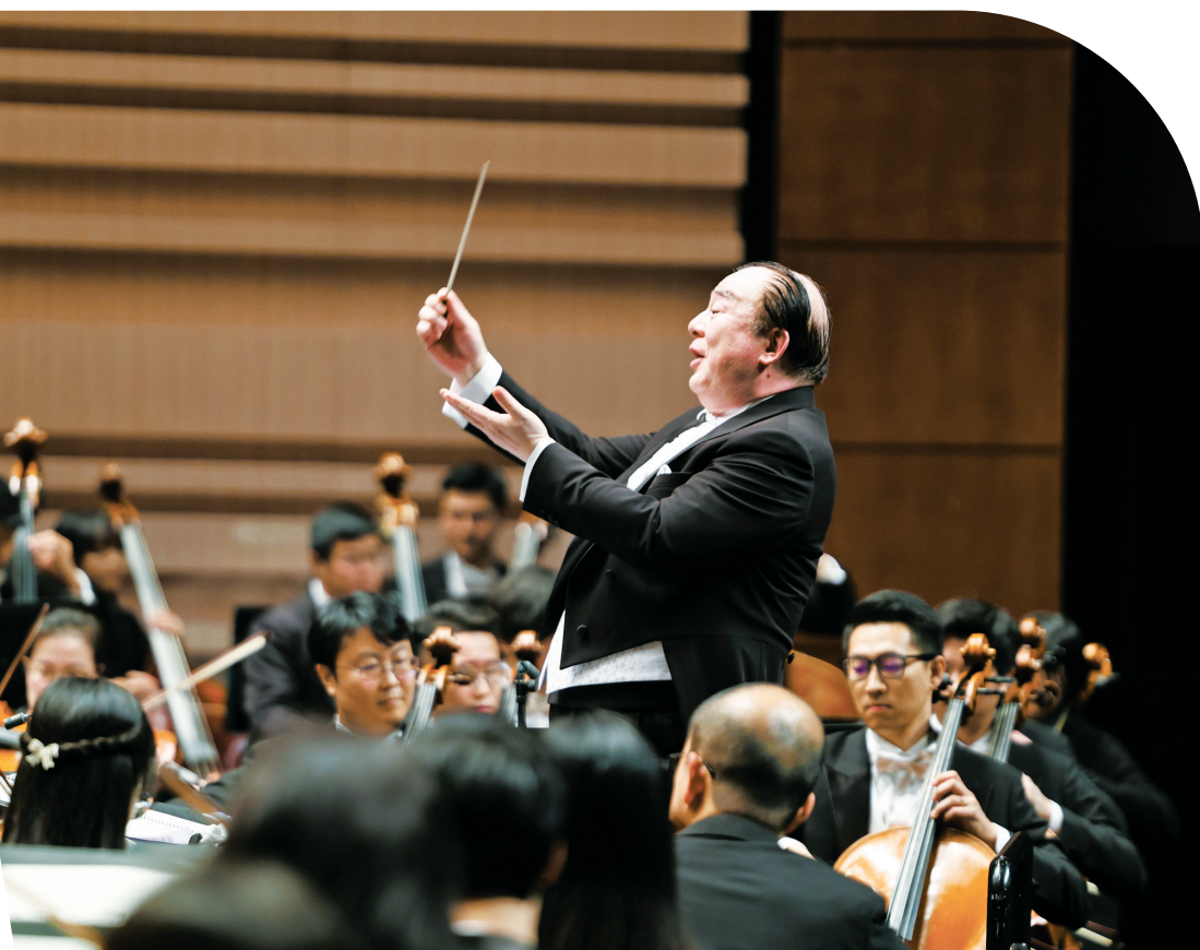
2023 宁波国际声乐比赛开幕式音乐会上，俞峰执棒。