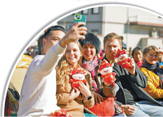
2023 宁波国际声乐比赛选手参加“文艺赋美”活动。

12月9日，一场主题为“音乐与文学的完美交汇——浅谈艺术歌曲中的诗歌”讲座，拉近了