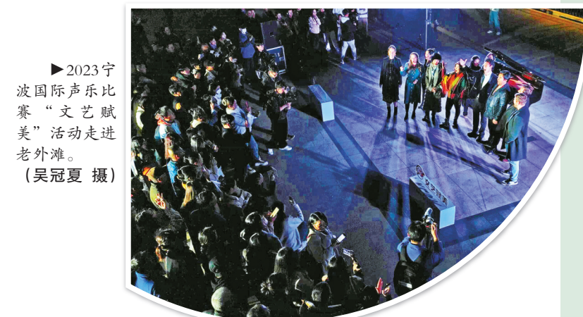
2023 宁波国际声乐比赛“文艺赋美”活动走进老外滩。