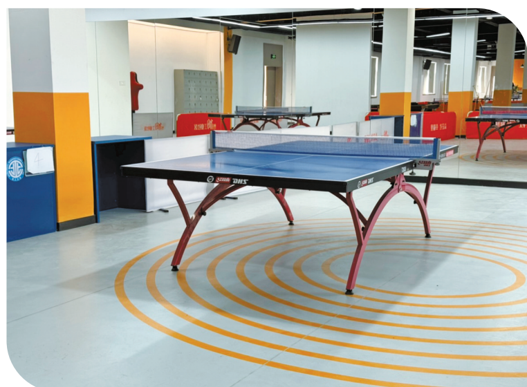
“智工之家”对外开放的场地。