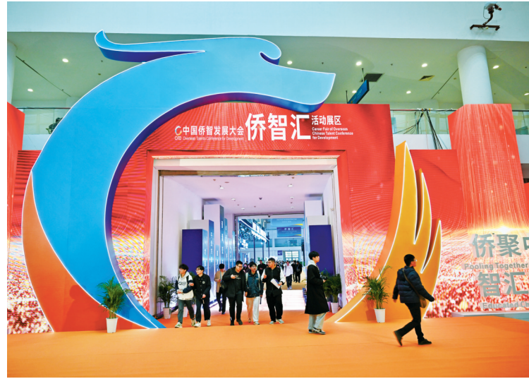
12月20日,参观者走出第一届中国侨智发展大会“侨智汇”活动展区。

当日,第一届中国侨智发展大会在福州开幕。来自37个国家和地区的千余名海内外嘉宾参会,并围绕重点领域侨界人才和经济发展开展交流合作。